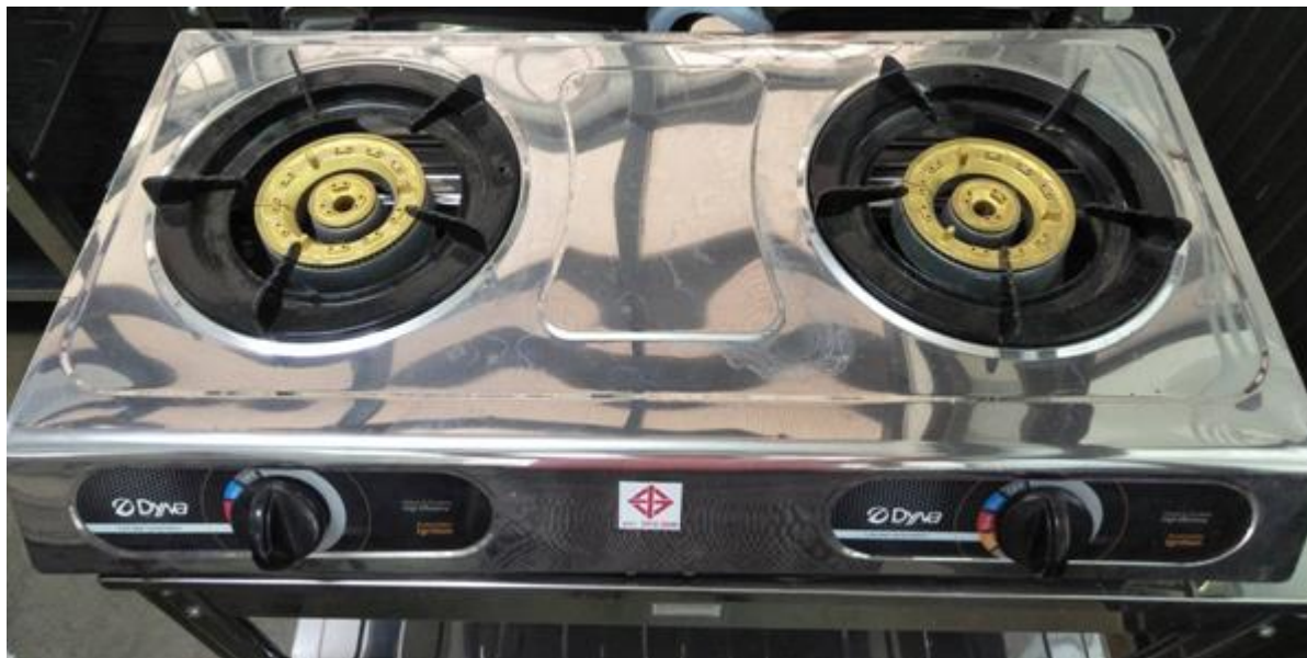
เตาแก๊สDynaHome ตั้งโต๊ะชนิด 2 หัวเตา หมายเลขครุภัณฑ์ 08.10.02/2560