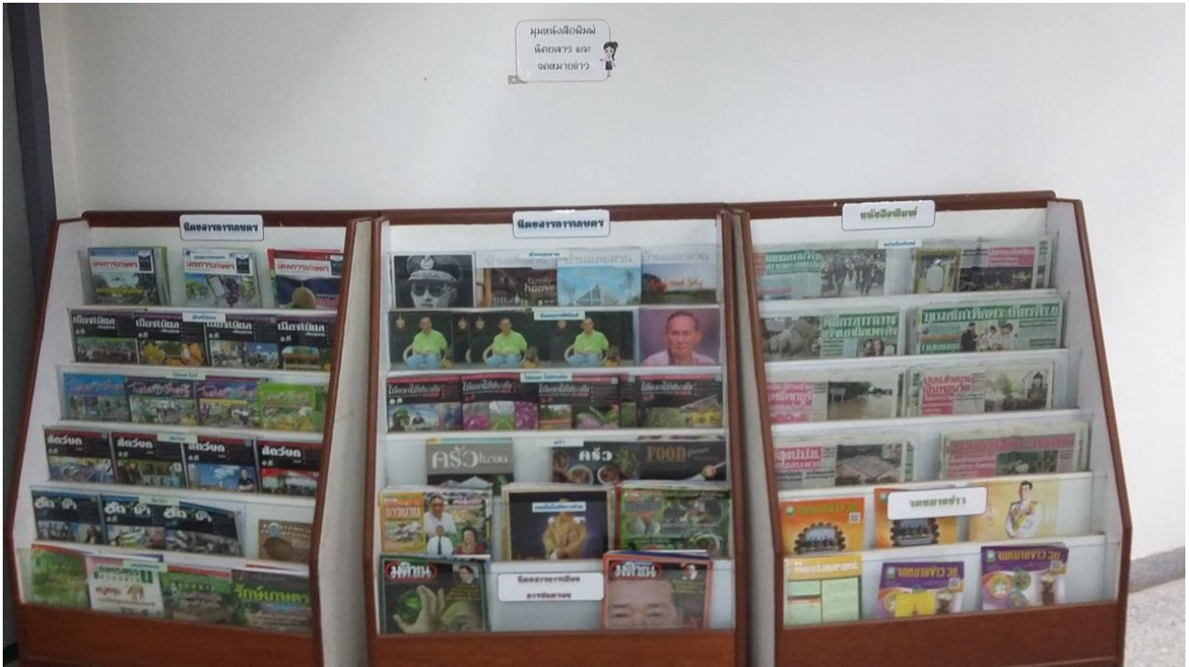
มุมอ่านหนังสือ