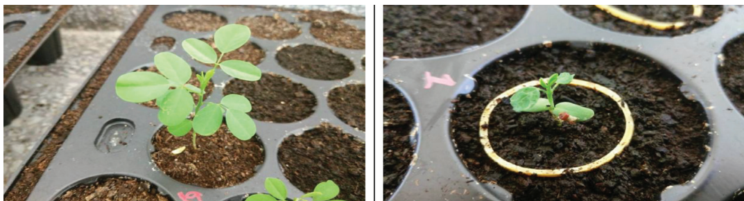
Figure 1 Characteristic of Indigofera tinctoria L. at 15 days, normal seedling (left) and abnormal seedling (right)