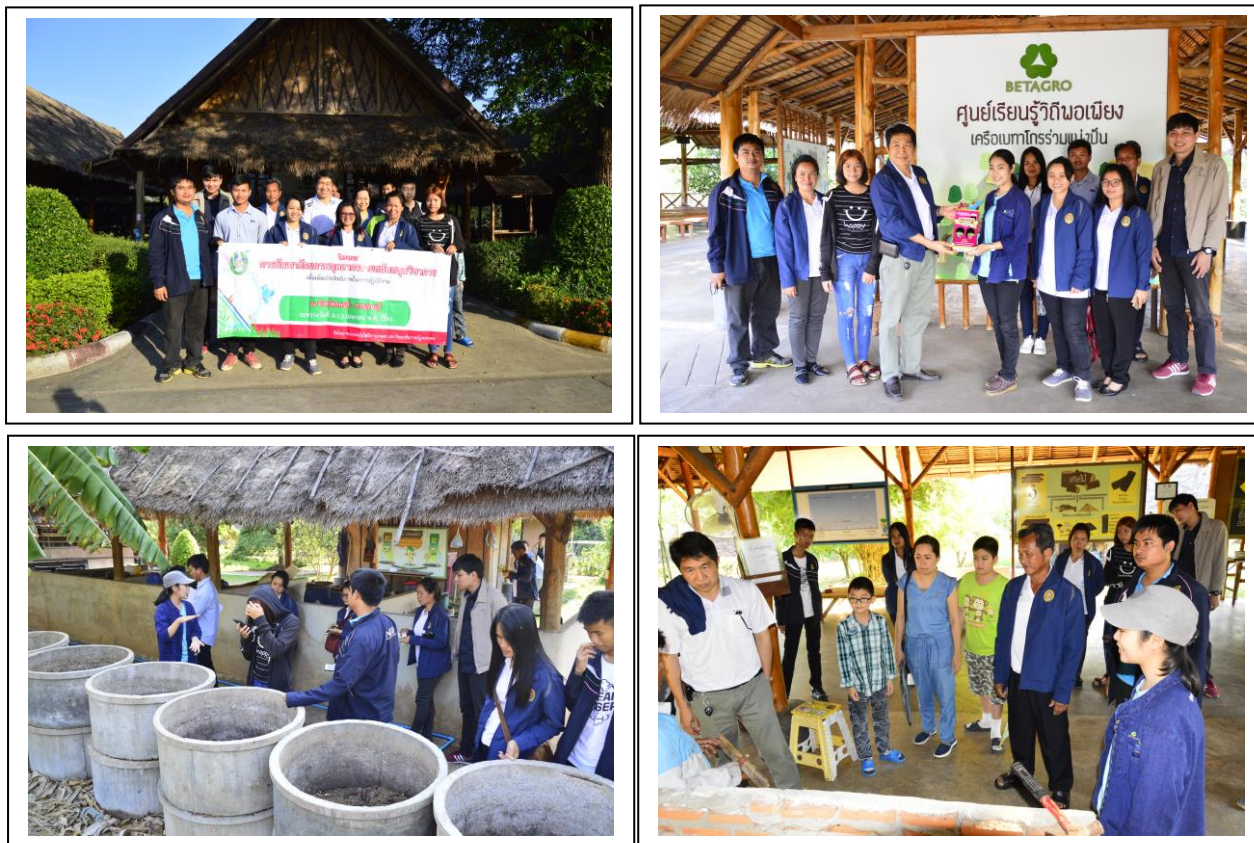
ภาพกิจกรรมศึกษาดูงาน