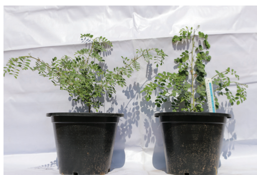
Figure 1 Plant characteristic of Indigofera tinctoria L. between diploid plant (left) and tetraploid plant (right) at 12 weeks

*, ** Represents significant at the P = 0.05 level and P = 0.01 level, respectively ns not significant df = 19