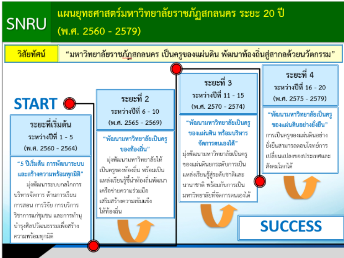
ภาพที่ 1 แผนยุทธศาสตร์มหาวิทยาลัยราชภัฏสกลนครระยะ 20 ปี พ.ศ. 2560 - 2579